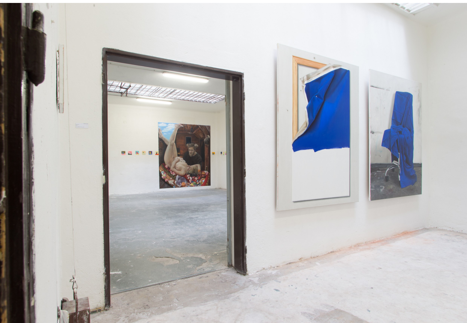
ATRIBUT – Galerie HYB4 – photo: Radúz Dětinský