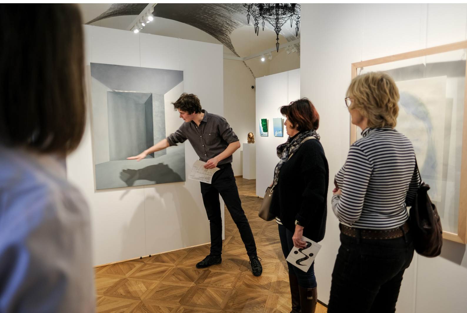
In:Form's guided tour – Galerie Arcimboldo